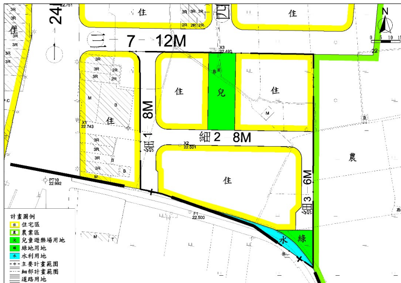
變更後土地使用計畫圖